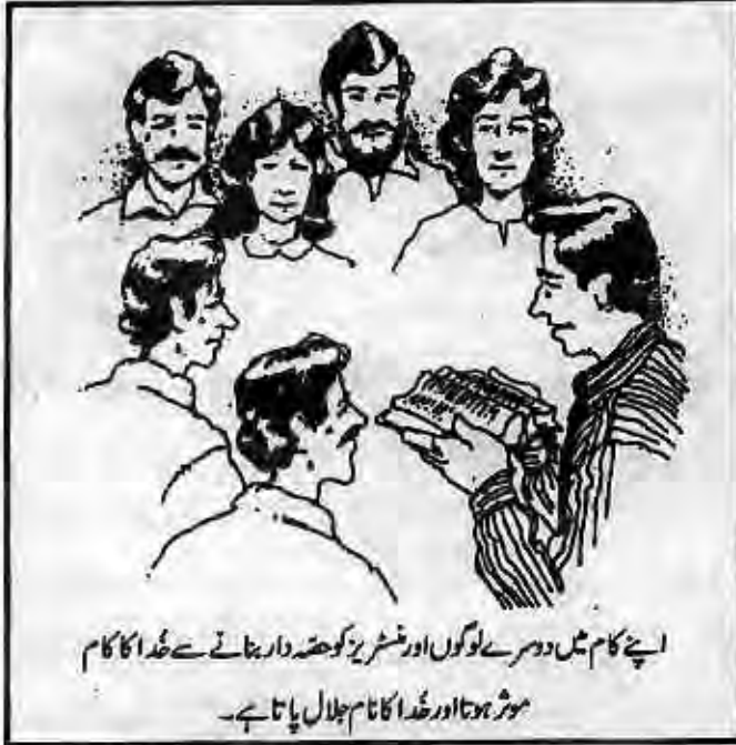
اپنے کام میں دوسرے لوگوں اور فشریز کو حصہ دار بنانے سے خدا کا کام موثر ہوتا اور خدا کا نام جلال پاتا ہے۔

خدا کسی فرد کو اپنی شخصی فشری بنانے کیلئے نہیں بناتا۔ خدا اپنے مقاصد پورے کرنے کیلئے انسان کو بناتا ہے تاکہ وہ یسوع کی طرح اس کے ساتھ مل کر خدا کی بادشاہی کو