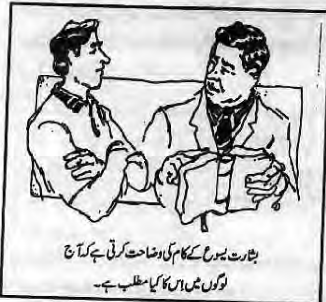
بشارت یسوع کے کام کی وضاحت کرتی ہے کہ آج لوگوں میں اس کا کیا مطلب ہے۔

اپنے پیغام میں لوگوں کو بتائیں کہ یسوع خُدا کے ساتھ ہمارے رشتے کو بحال کرنے