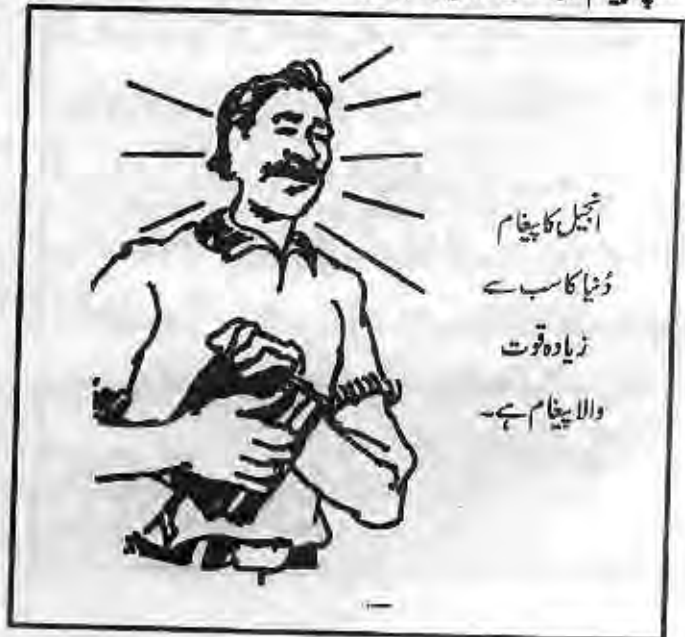
انجیل کا پیغام دُنیا کا سب سے زیادہ قوت والا پیغام ہے۔

یسوع نے اپنی خدمت کے دوران لوگوں سے رُور عمل کیلئے کہا۔ یسوع جب اندھے شخص کو شفا دینے کے بعد ملا تو اُس نے اندھے کو اُس پر ایمان لانے کو کہا۔ (یوحنا 9:35-38) یوحنا کی انجیل باب 4 میں ہم دیکھتے ہیں کہ یسوع سامری عورت سے کنوئیں پر گفتگو کرنے کے بعد عورت کو اُسے خُدا کا بیٹا قبول کرنے کو کہا تھا۔ ایک اچھا مبشر ہر موقع پر لوگوں کا رُور عمل دیکھنا چاہتا ہے۔ لوگوں کو چاہیے کہ پاک کلام کی سچائی کو سننے کے بعد اُس پاک کلام پر جوابی اقدام بھی لیں۔