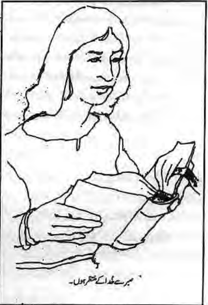
میرے خُدا کے شکر ہوں۔

خُدا پر بھروسہ کریں کہ وہ گناہ گاروں کا تعلق یسوع کے ساتھ ضرور بنائے گا۔ خُداوند نے پولوس رسول سے کہا ” اور خُداوند نے رات کو رویا میں پولوس رسول سے کہا خوف نہ کر بلکہ کہے جا اور چپ نہ رہ..... کیونکہ اس شہر میں میرے بہت سے لوگ ہیں۔“ (اعمال 9:18) پاک رُوح کی قوت پر بھروسہ کریں جو آپ کے ساتھ اور آپ