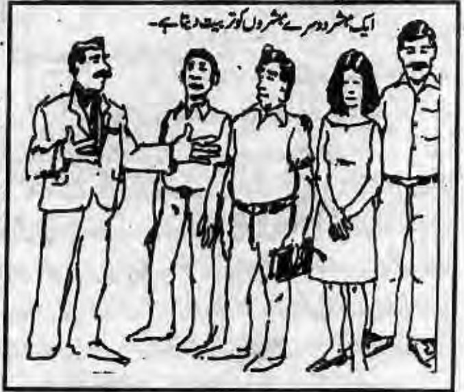
ایک مبشر دوسرے مبشروں کو تربیت دیتا ہے۔

کئی مبشر اپنی خدمت کے کام میں بہت کامیاب ہوتے ہیں۔ تاہم وہ اپنا علم۔ مہارتیں اور تجربہ دوسروں کو منتقل کرنے میں ناکام ہوتے ہیں۔ اگرچہ ایک مبشر ہزاروں کو سچ کے پاس لاسکتا ہے لیکن اگر وہ نئے مبشروں کو تربیت نہیں دیتا تو وہ اپنے مقصد کو پورے طور پر پورا نہیں کرتا۔ خُدا چاہتا ہے کہ اُس کے رہنما (مبشران۔ پاسبان۔ اُستاد اور دوسرے خادم) دوسروں کو تربیت دیں تاکہ خُداوند کا کام ترقی کرے۔ (آفسیوں 2:11، 12:4-2، تیمتھیس 2:2) ایسا کرنے سے خدمت کا کام ہر قوم و نسل میں پھیل جاتا ہے۔ اگر آپ مبشر ہیں تو آپ کس شخص کو بشارتی کام کرنے کیلئے تربیت دے رہے ہیں؟ خدمت کے کام میں کون آپ کی بیرونی کرے گا؟ پولوس رسول نے تیمتھیس کو لکھا: ”او جو باتیں تُو نے بہت سے گواہوں کے سامنے مجھ سے سُنی ہیں اُن کو ایسے دیباقتدار آدمیوں کے سپرد کر جو اوروں کو بھی سکھانے کے قابل ہوں“۔ (2:2 تیمتھیس) ہر رہنما کو چاہیے کہ وہ اپنی آنے والی نسل کو کلام کی باتیں سکھائے اور اپنا تجربہ اور علم اُن میں منتقل کرے اور پھر ان تربیت یافتہ لوگوں کو بطور مبشر دوسروں کو تربیت دینی چاہیے۔