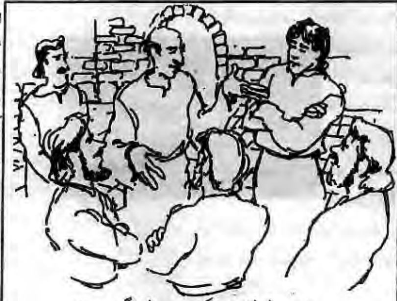
پولوس رسول کے سفروں کی وجہ سے وہ اُن لوگوں سے ملا جنہوں نے کبھی یسوع کے بارے میں نہ سنا تھا۔

مبشر حضرات پیاروں اور بد رُوح گرفتہ لوگوں کی شفا کیلئے دُعا کرتے ہیں۔ مبشر لوگوں کی نجات کا پیغام سنانے کیلئے اُن سے ملاقات کرتا ہے اور زندہ اور سچے خُدا کی خدمت کرتا ہے۔