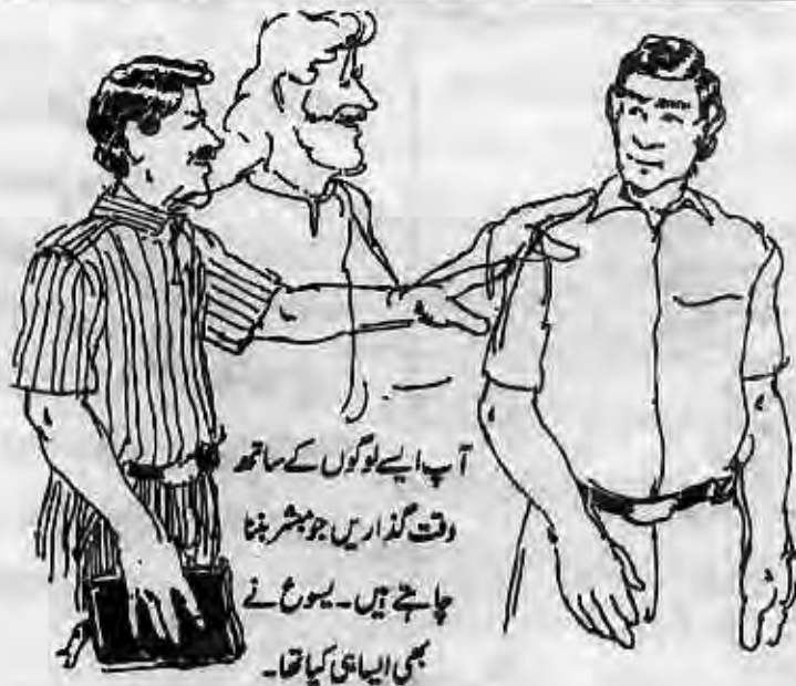
آپ ایسے لوگوں کے ساتھ وقت گزاریں جو مبشر بننا چاہتے ہیں۔ یسوع نے بھی ایسا ہی کیا تھا۔

اس طرح یسوع نے اپنے شاگردوں کی تربیت کی۔ آپ کو ایسے لوگوں کے ساتھ وقت گزارنا چاہیے جو مبشر بننا چاہتے ہوں۔ پاستر حضرات کو چاہیے کہ وہ تجربہ کار مبشروں کو تلاش کریں جو نئے مبشروں کو تربیت دے سکیں۔ وہ مبشر آپ کا دوست یا ہم خدمت