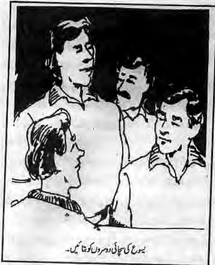
یسوع کی سچائی دوسروں کو بتائیں۔

سے مسلسل معمور اور تازہ دم ہونے کی ضرورت ہے تاکہ ہمارے دل اور منہ خدا کی تعریف اور شکرگذاری سے بھرے رہیں۔